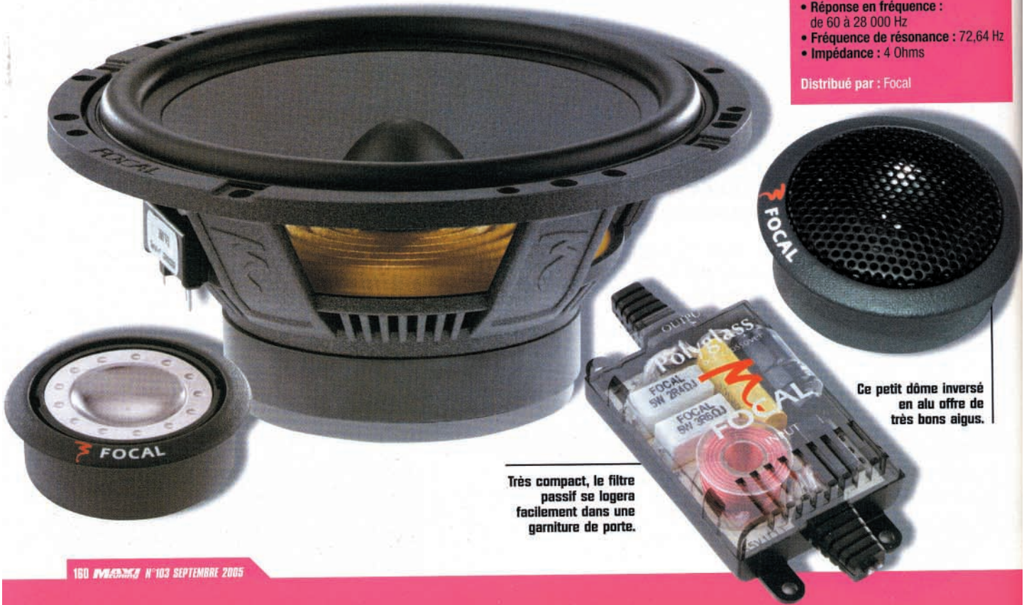
Ce petit dôme inversé en alu offre de très bons aigus.